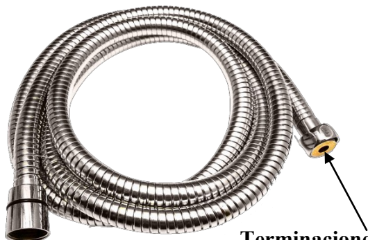
Terminaciones en latón